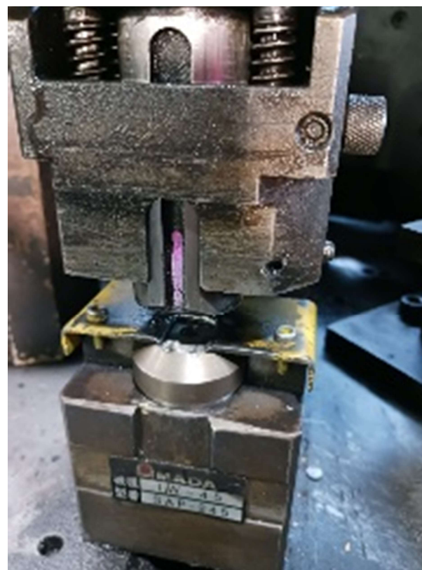
2工程目で潰し+穴あけ