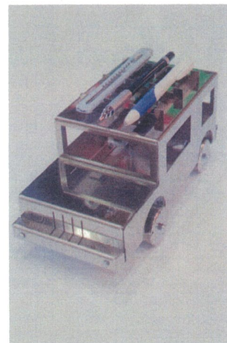
四駆のペンホルダ