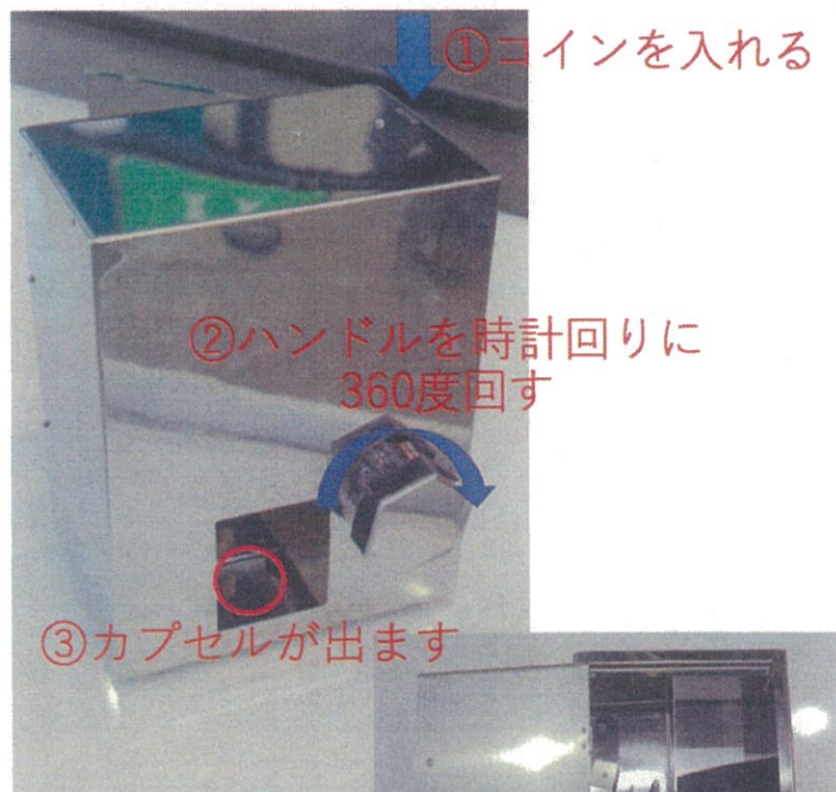
何がでるかな？ TAKATECHカプセルポン