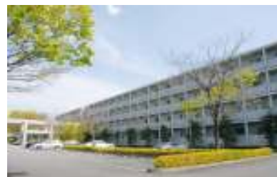
宿泊施設：アマダグループ大磯寮