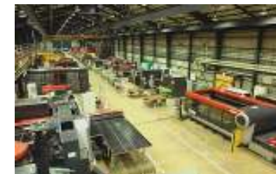
主講習会場：伊勢原本校