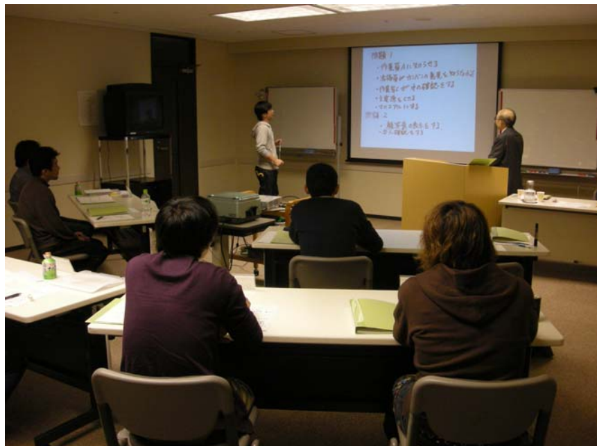
演習 : 個人検討課題の発表