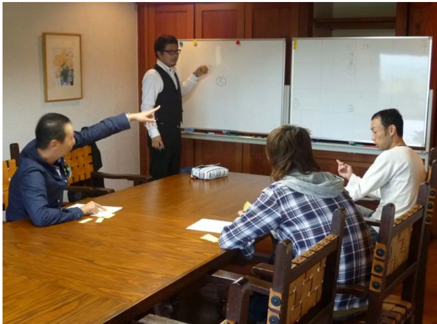
演習 : チーム討議風景