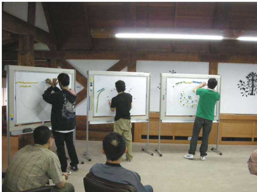
体験演習 : タイムトライアル 条件、方法の差による生産性