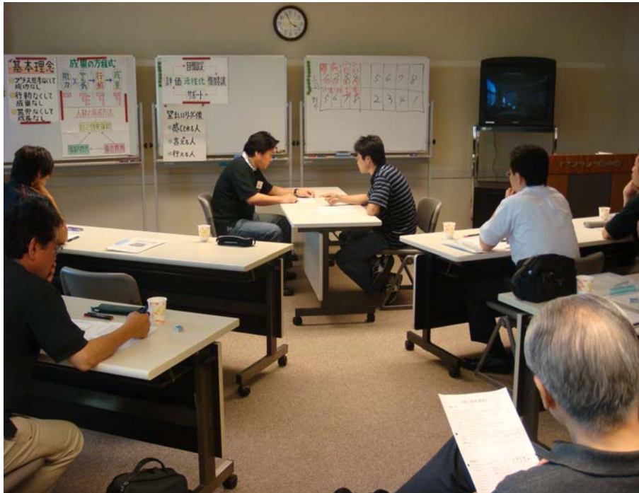
課題演習： 部下との個人面談（ロールプレイング）