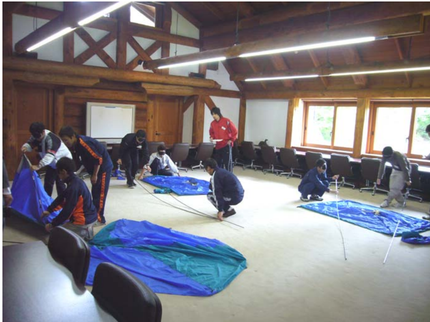
体験演習 : 口頭による情報伝達の難しさ