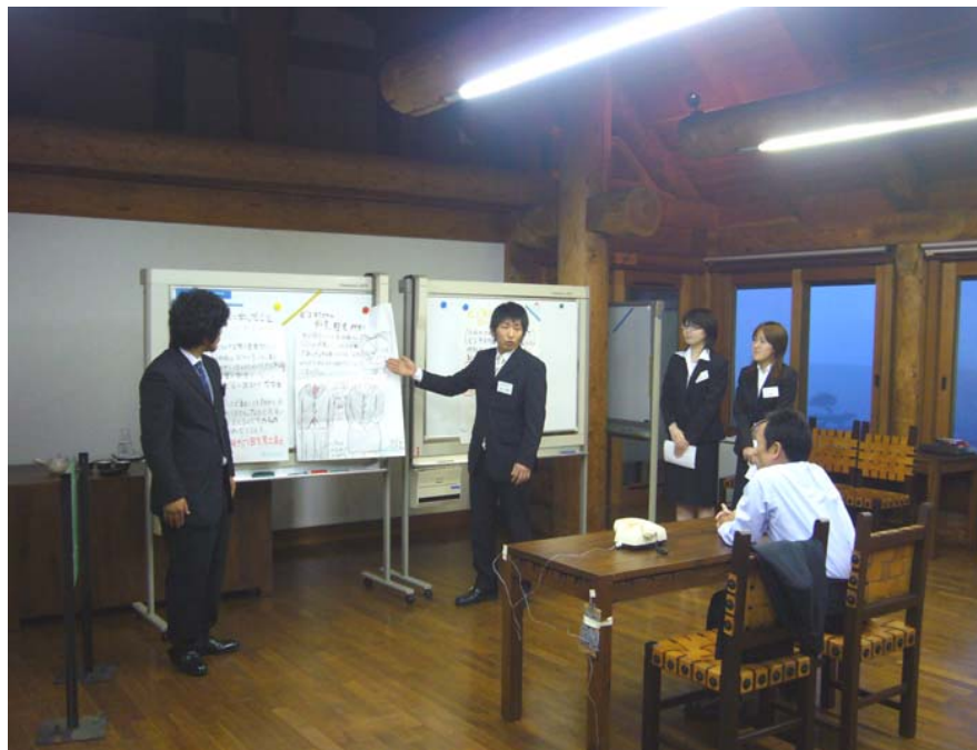
演習:ビジネスマナー ロールプレイング(Ⅱ) 社長への研修報告